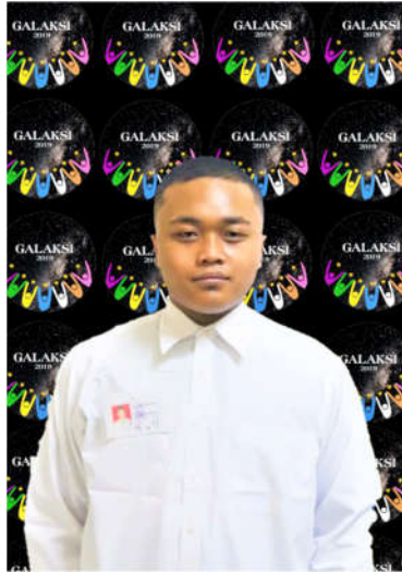
Contoh potongan rambut Peserta PKKMB Laki-laki