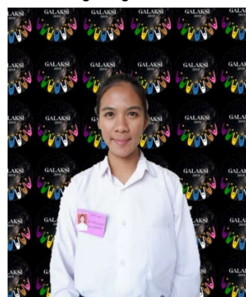
Contoh peserta PKKMB yang tidak menggunakan kerudung