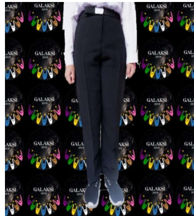
Contoh seragam bawahan peserta PKKMB perempuan (celana)