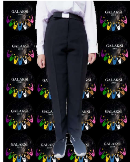
Contoh baju dan celana Peserta PKKMB Laki-laki