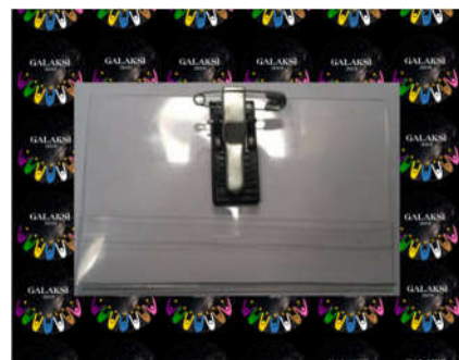
Contoh untuk Name tag

3. Peserta PKKMB diwajibkan berpenampilan rapih, bersih, dan sopan dengan ketentuan: