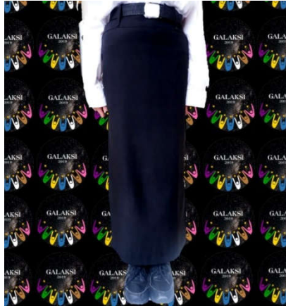
Contoh seragam bawahan peserta PKKMB Perempuan (rok)