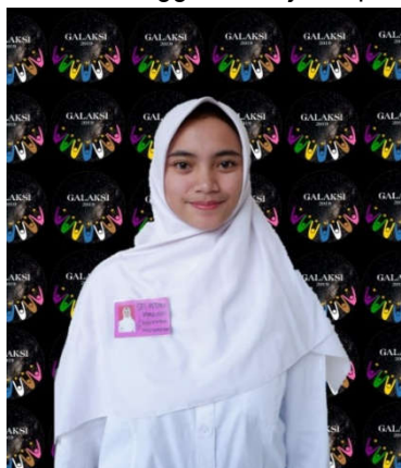
Contoh peserta PKKMB yang menggunakan Kerudung